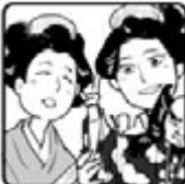
◀ まゆ・まな ▶