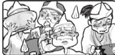
◀ 江戸初期 豪商の皆さん ▶

世界の商人を相手に活躍したが、ある出来事がきっかけで世間から忘れ去られてしまった。