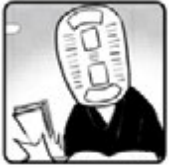
◀ カネ介 ▶