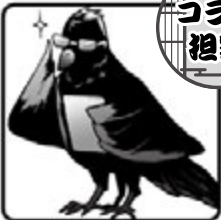
◀ コラム担当 ▶