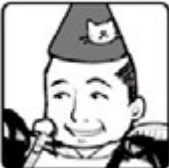
◀ 大家さん ▶