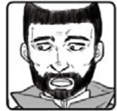
◀ フランシスコ・ザビエル ▶