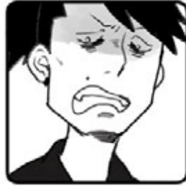
◀ タカ ▶