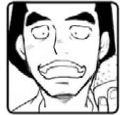
◀ 先生 ▶