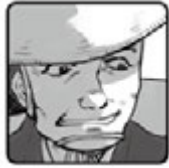
◀ 弥次郎兵衛 ▶