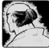
◀ こうのいげせんうえもん 鴻池善右衛門 ▶