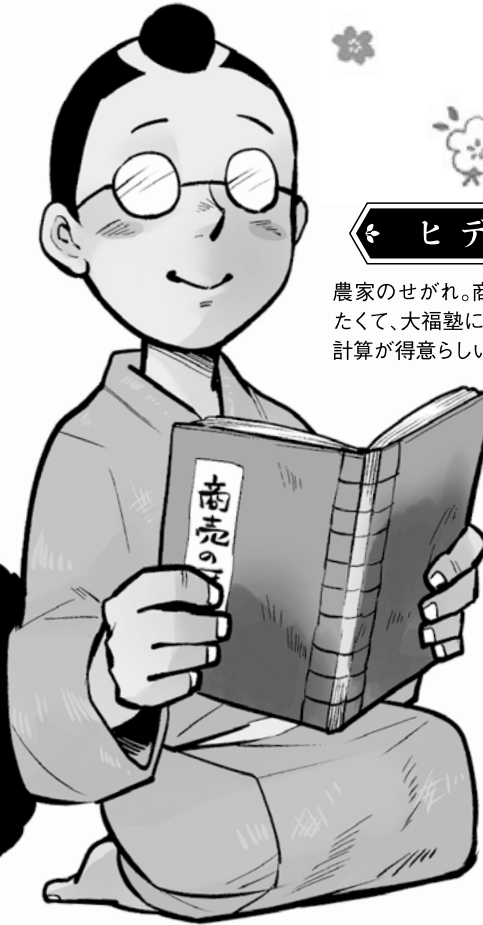
◀ ヒデ ▶